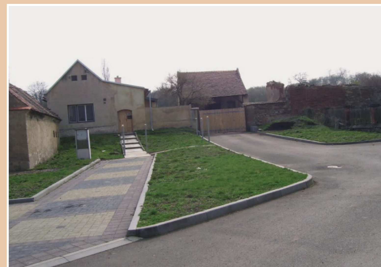
Současný stav staré kovárny

V čele domu byly v rámci rekonstrukce obnoveny sluneční hodiny s klasickým německým nápisem „MACH ES WIE DIE SONNE UHR, ZÄHL DIE HEITREN STUNDEN NUR“ („Dělej to jako sluneční hodiny, počítej pouze jasné hodiny“).