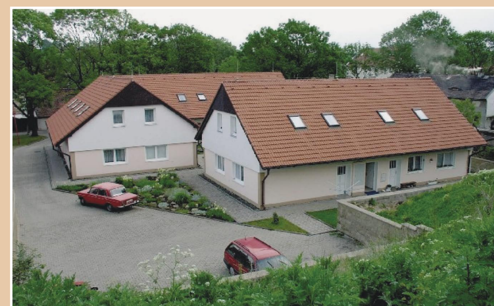
Stejný pohled dnes – obecní domy na místě zbouraného statku č. p. 18 (sušárny)