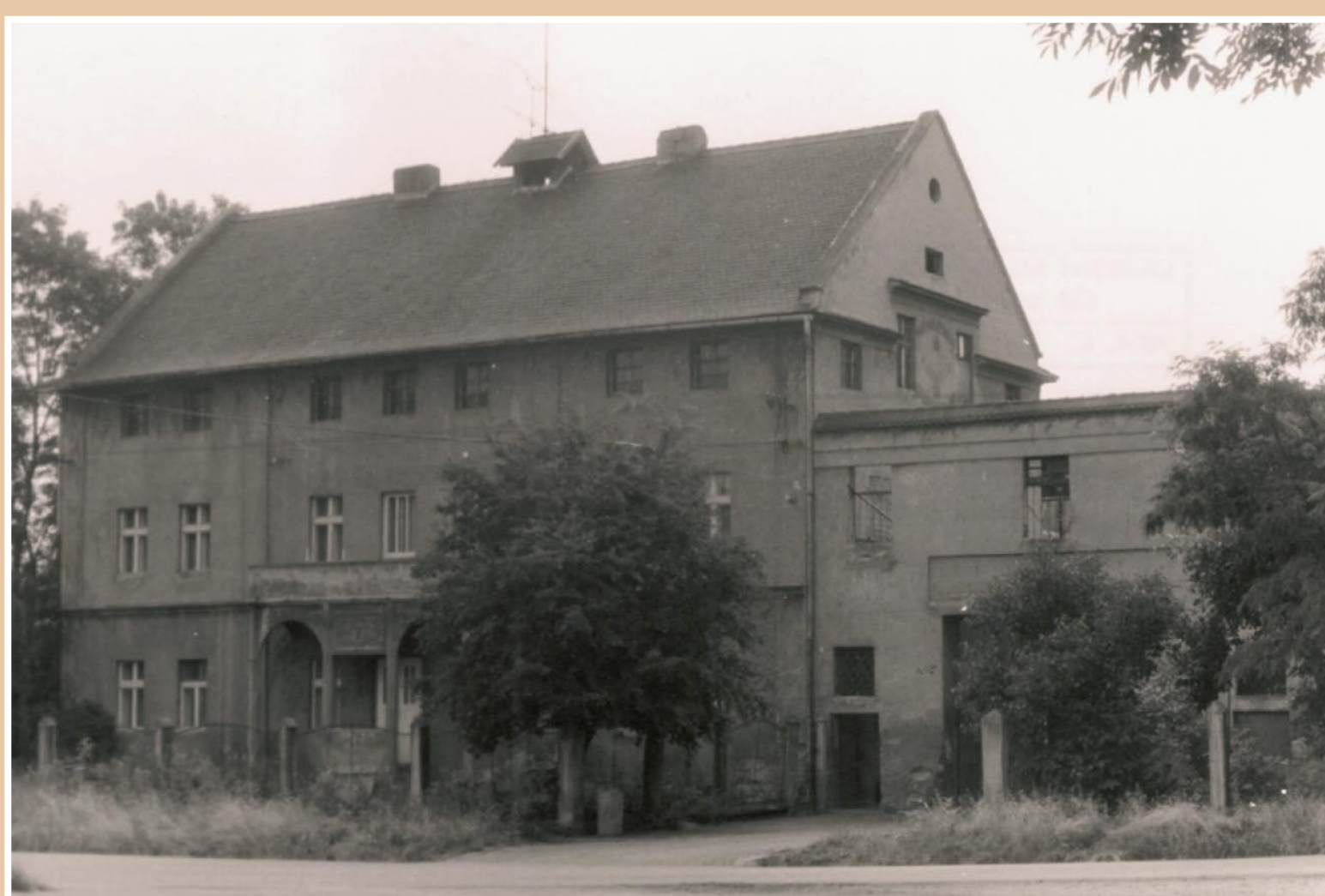
Objekt č. p. 14 před rekonstrukcí