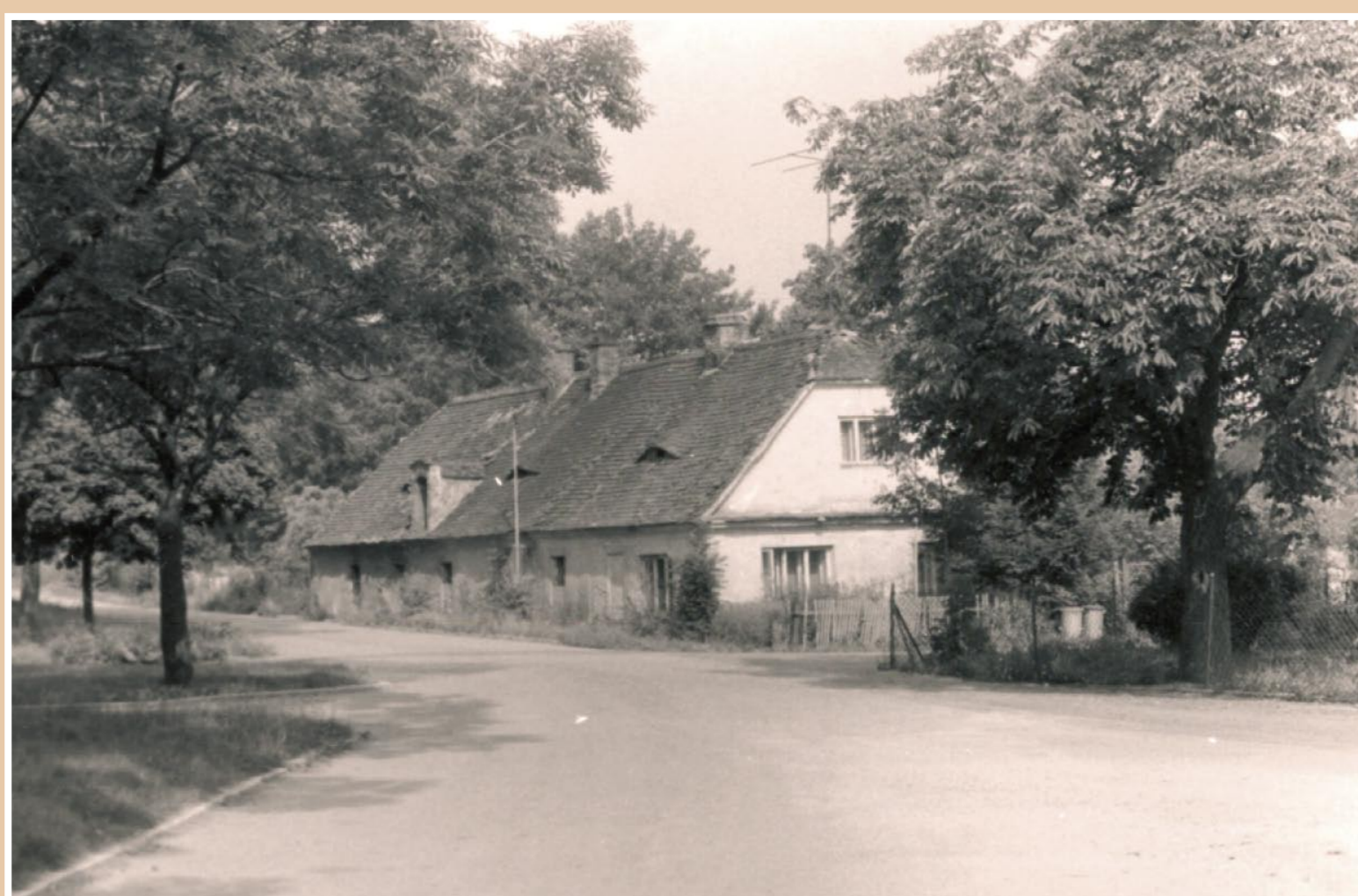
Bývalá obecní kovárna č. p. 12