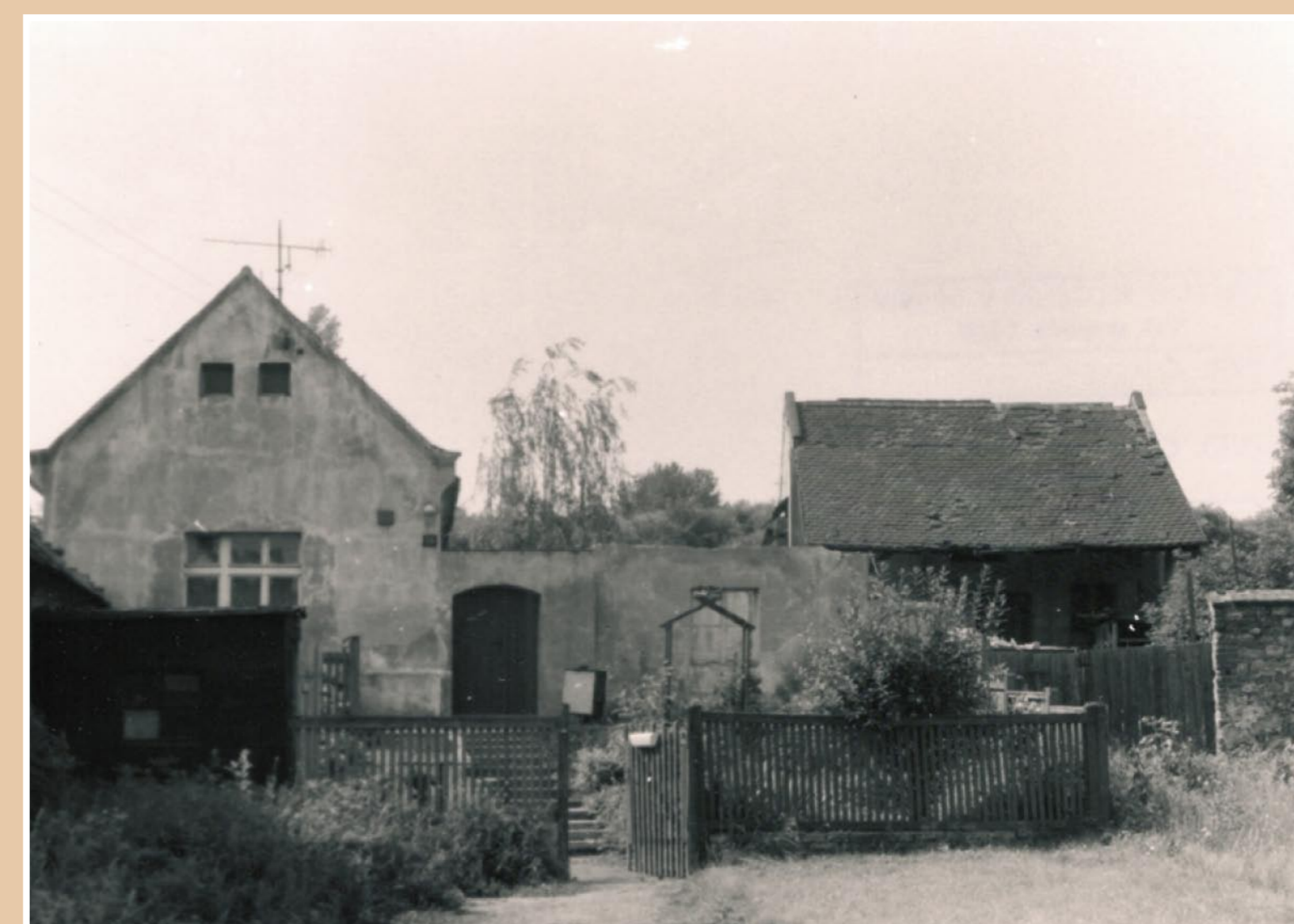
Č. p. 29 (vlevo) – během II. svět. války ubytovna pro strážu Č. p. 30 (vpravo) – budova staré kovárny

V obci se nacházela ještě starší kovárna v č. p. 30 na návsi – „Kozí Ring“ viz obr. Budova již neexistuje. Toto zaniklé stavení bylo během války používáno jako malý zajatecký tábor. Vedlejší budova č. p. 29 též na obr. vlevo sloužila k ubytování stráže.