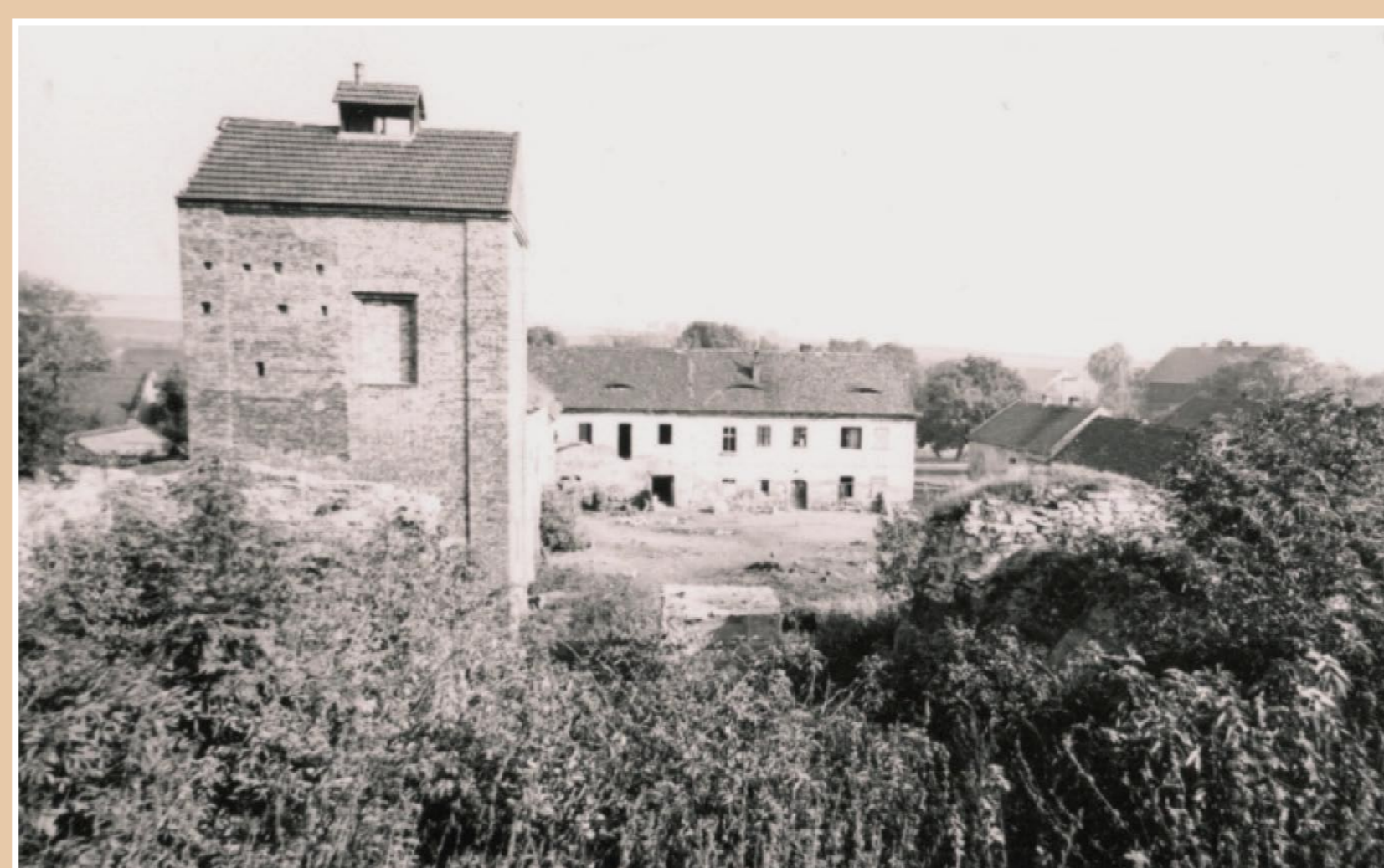
Objekt sušárny těsně před likvidací