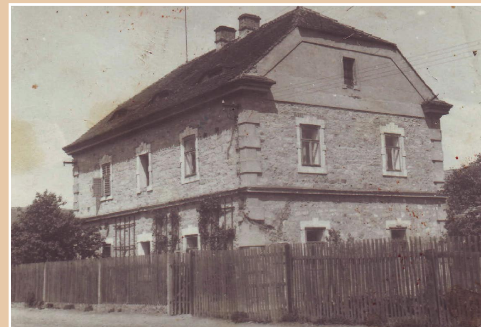
Obytná budova č. p. 55 na Masném Dvoře

Jedna z pověstí hovoří o tom, že z jistého sklepení domu v Masném Dvoře vedla tajná podzemní chodba do Blažimi. V chodbě byla prý ve středověku zaživa zazděná provinilá jeptiška. Ze sklepení toho domu se v noci často ozývaly divně nevysvětlitelné zvuky.