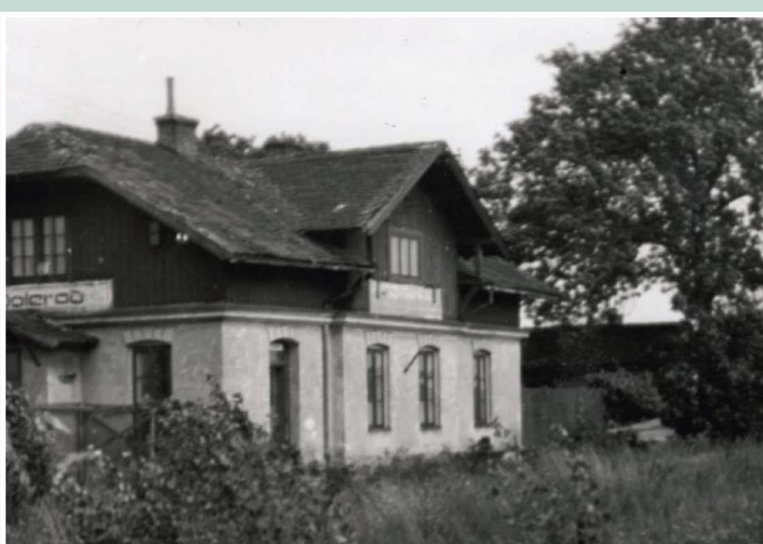
Nádražní budova v Poleradech – vedle silnice na bývalé Třiskolupy

Stávající viadukt, u kterého se nacházíte a stezka směrem k malému Březnu se nachází v místech bývalé železniční trati Počerady Vrskaň. Císařské a královské státní dráhy Rakouska (KKSTB) uvedly tuto železniční trať z Počerad do Vrskaň do provozu dne 1. března roku 1887. A s ním i poslední zachovalý, dosud funkční a více jak 120 let starý viadukt na této trati – v Poleradech. Stavba je dokladem stavebního umu tehdejších stavitelů. Viadukt se stal přirozenou součástí krajiny a později se stal jakousi skrytou stavbou, která čekala na své objevení.