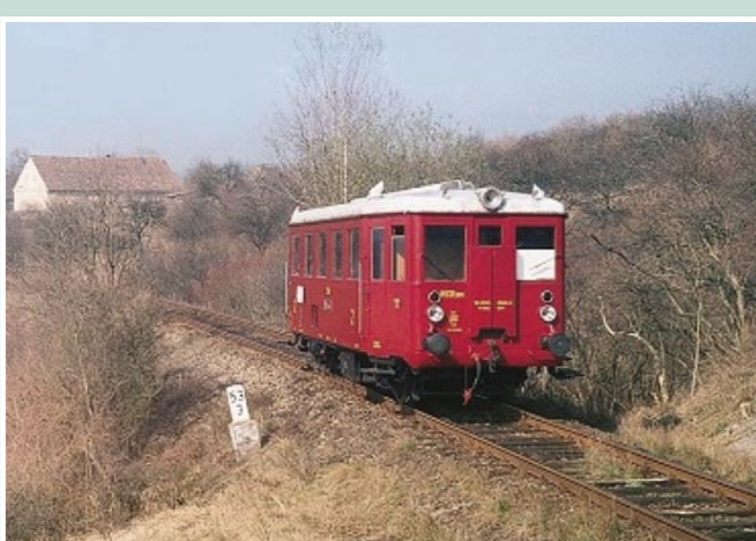
Motorový osobní vlak M 131.1 jezdící na trase Vrskaň – Počerady

Jednalo se o jednokolejnou trať s rozchodem 1 435 mm o délce 18 km.