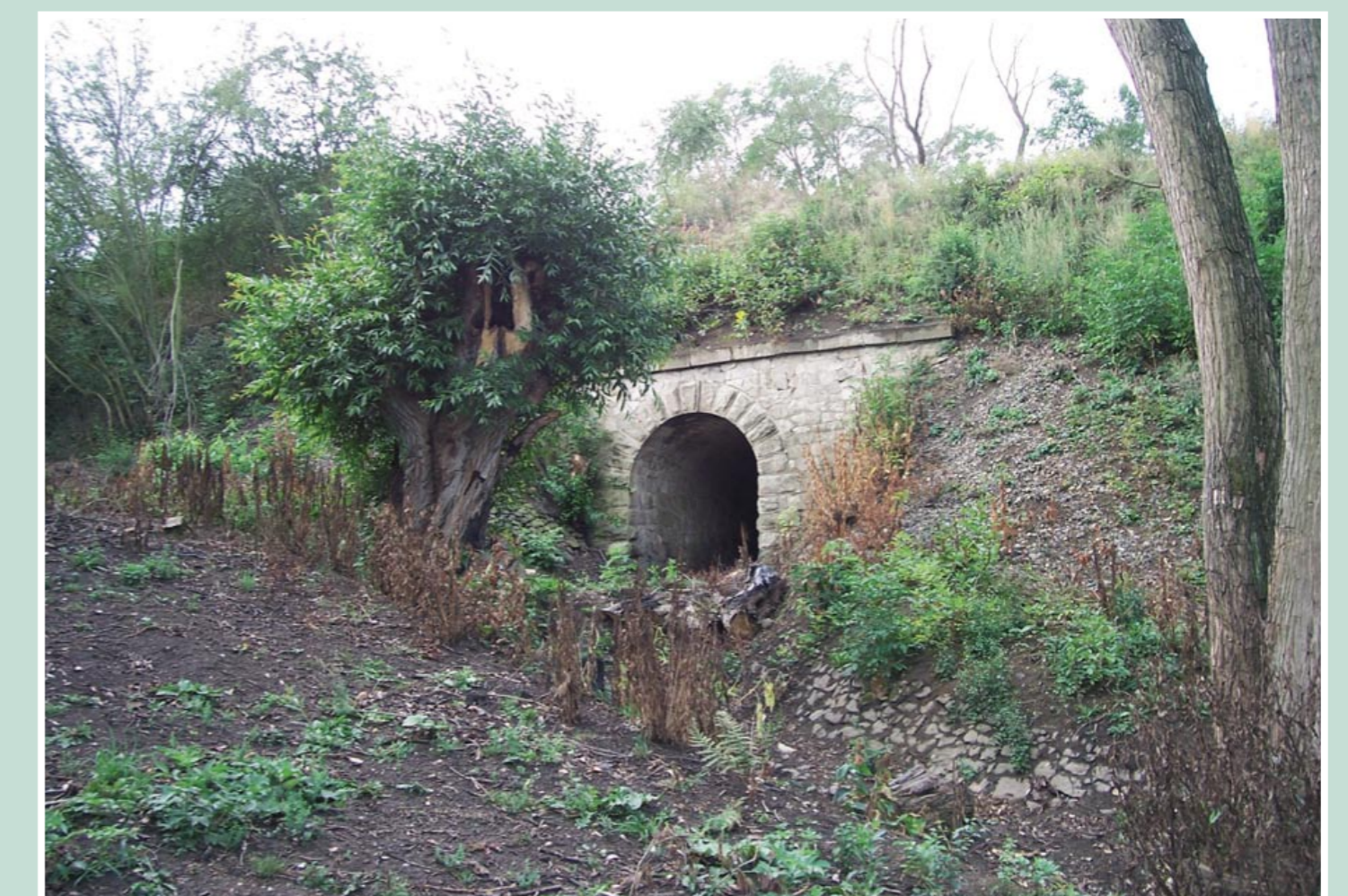
Těleso viaduktu – stav po obnově

V průběhu 19. století bylo v okolí Polerad nejméně osm dolů. Na počátku 20. století se stala nejvýznamějším dolem Hermann – Walter přejmenovaný v roce 1924 na důl Moravia, v roce 1942 připojená k šachtě Mariana ve Skyřicích. Vytěžené uhlí bylo dopravováno z Moravie na Poleradské nádraží lanovkou přes údolí Srpiny – ze staré fotografie pozornému čtenáři neuniknou patrné sloupy.