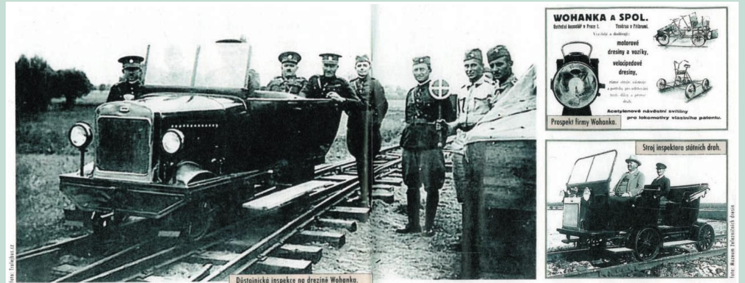
Firma Wohanka vyráběla mmj. dreziny