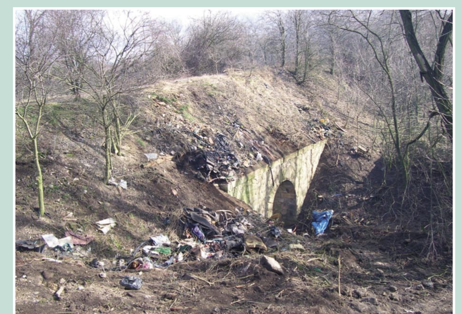
Těleso viaduktu – stav před obnovou