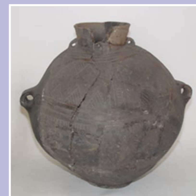
Keramická amfora – Šňurová kultura 2700–2300 př. Kr. – nález Polerady