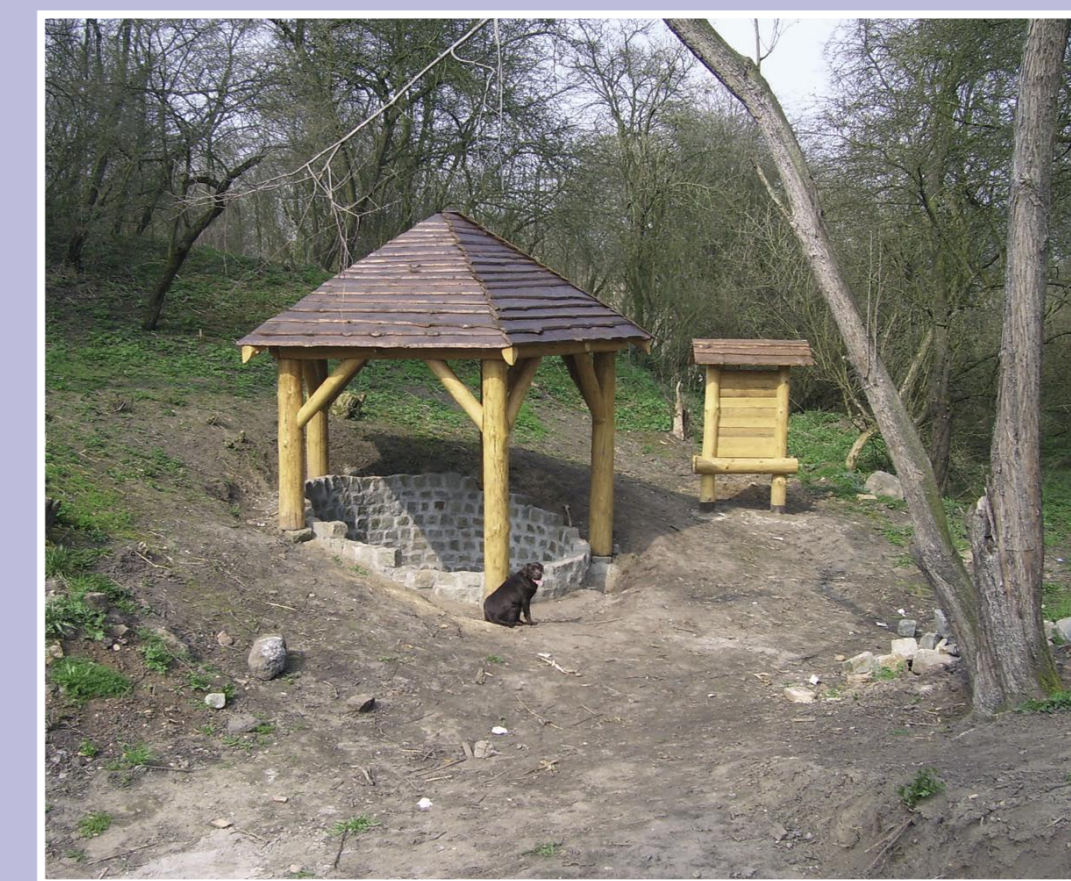
Studánka po rekonstrukci