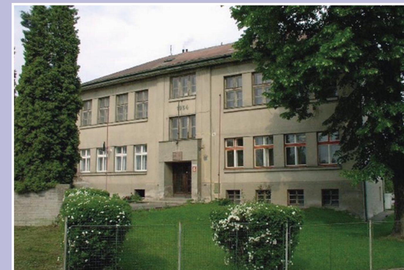
Budova bývalé české školy. Pamětní tabule nad vchodem připomíná posledního řídícího učitele pana Vratislava