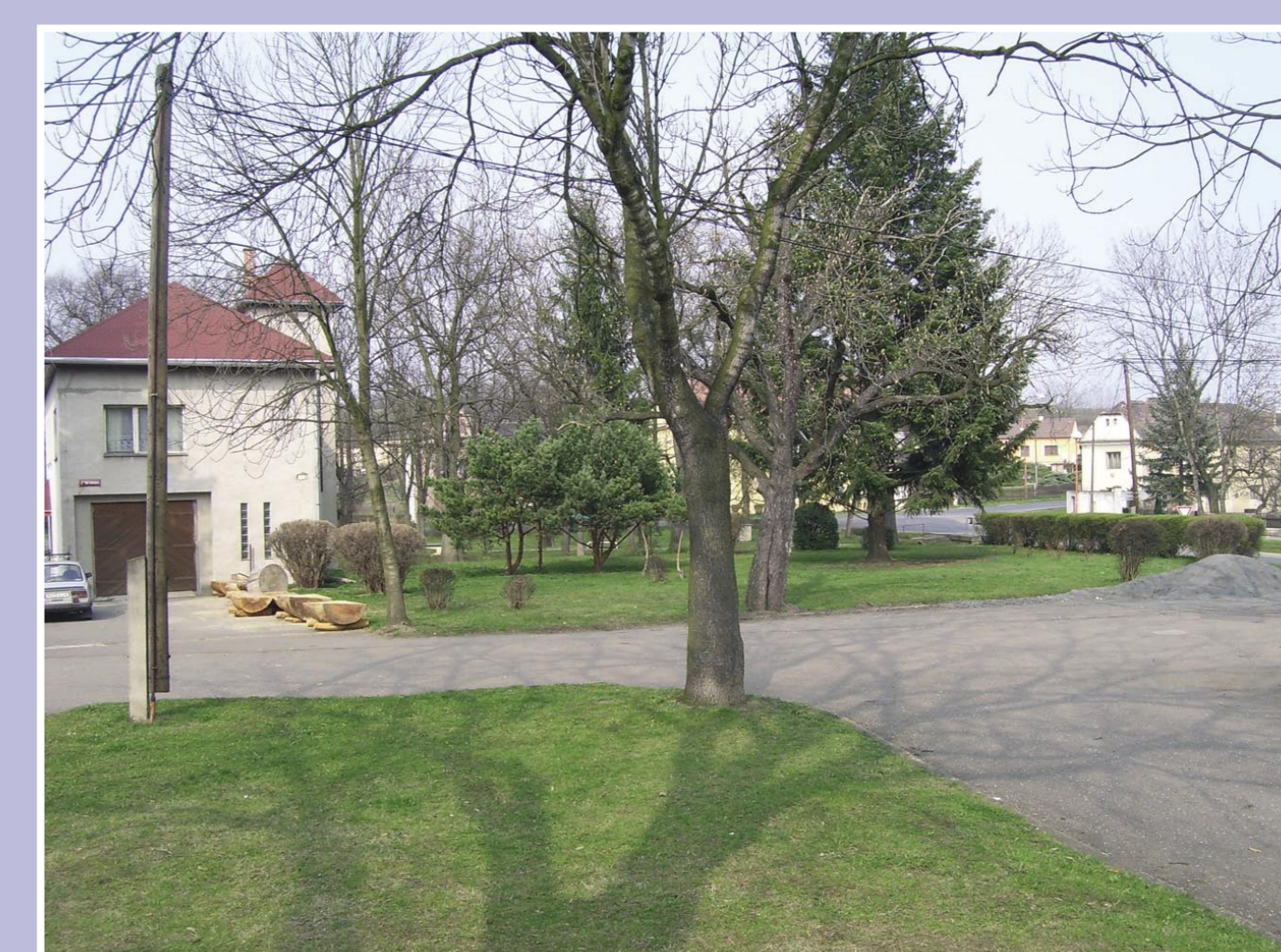
Současný pohled na náves