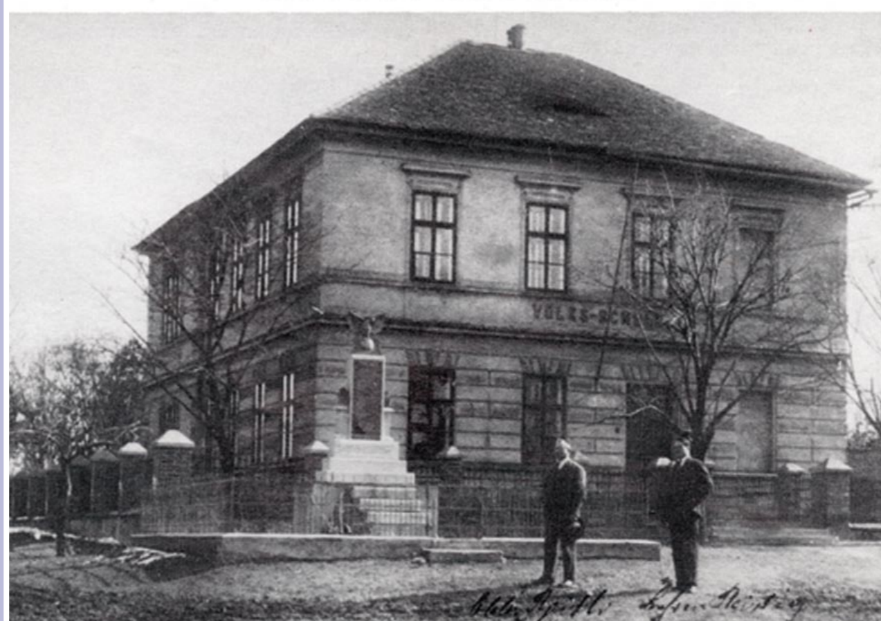
Německá škola z počátku 20. století. V popředí je pomník padlým vojákům z Polerad v 1. světové válce.