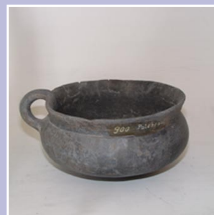
Keramický koflík – Knovízská kultura 1250–900 př. Kr. – nález Polerady

V době, kdy se v Egyptě již stavěly pyramidy, se na katastru obce Polerady v chatrčích z větví a hlíny usadili první lidé – tj. 2700–2300 let před Kristem v pozdní době kamenné. Nejprve lid kultury se šňurovou keramikou, poté v době 2000–1500 let př. Kr. ve starší době bronzové lid Únětické kultury a ještě později lid kultury Knovízské. Asi 500 let před Kristem se na tomto území objevují Kelty a Germáni.