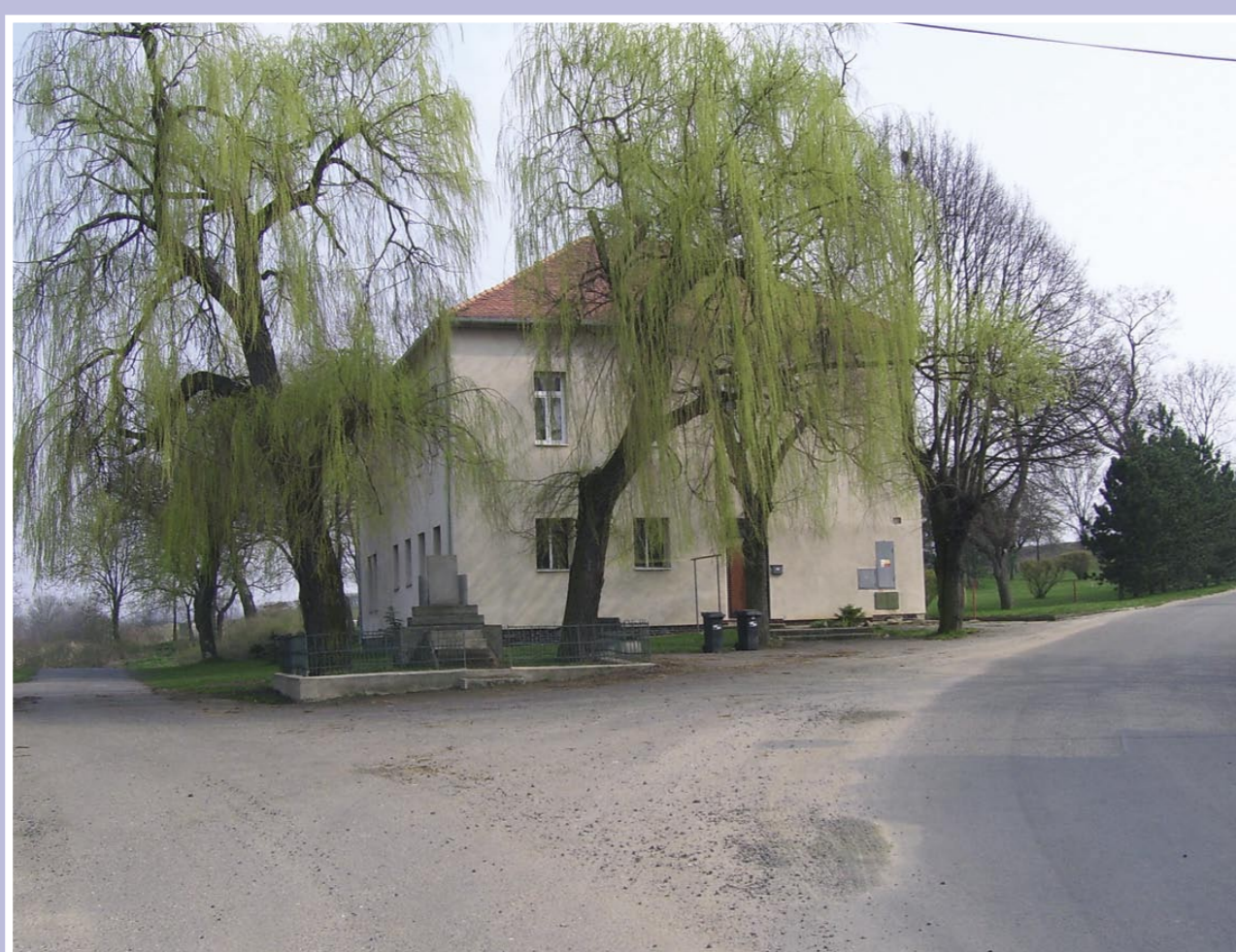
Dříve německá škola, nyní obecní bytový dům