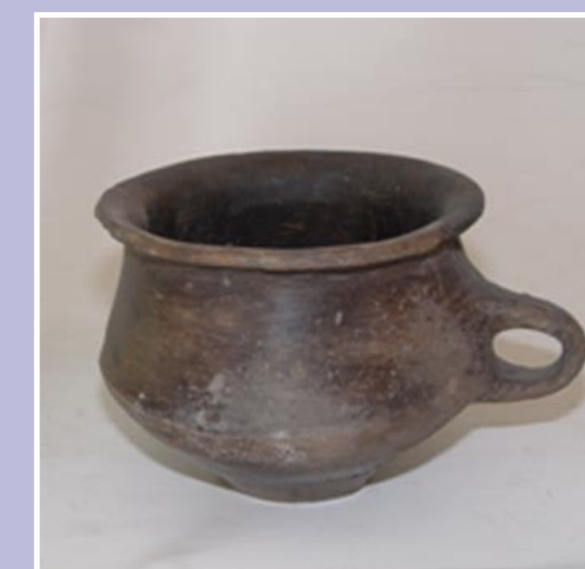
Keramický koflík – Únětická kultura 2000–1500 př. Kr. – nález Polerady