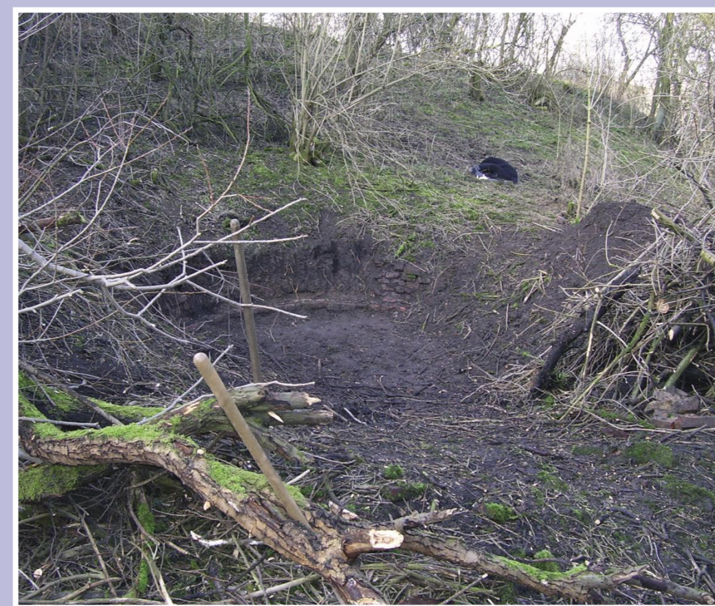
Studánka před rekonstrukcí – zbytky původní vyzdívky

Na základě informací pamětníků byly v těchto místech objeveny zbytky staré cihlové kruhové vyzdívky se dvěma schody, které posloužili jako základ pro znovuoobnovení studánky, u které se právě nacházíte. I když se jednalo o nevelký pramen a každý dům měl vlastní studnu, voda z této studánky byla díky svým vlastnostem hojně využívána místními hospodyňkami k praní velkého prádla.