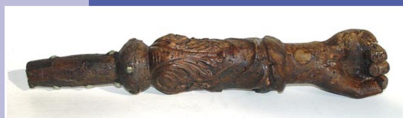
Rychtářské právo z Polerad